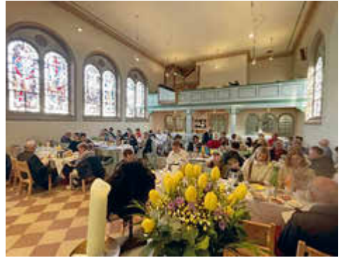
Ostersonntag in Seligenstadt