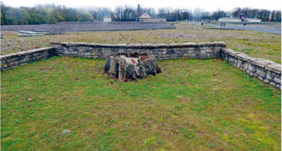
Eine Gruppe aus allen Ortskirchengemeinden der „Mainperlen“ erkundete am 14. und 15. März die Gedenkstätte Buchenwald.