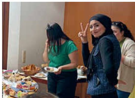
Die Ruhe vor dem Sturm am Kuchenbuffet

Seit dem ersten Cafénachmittag ist der offene Kinderclubkeller durchgängig ein be-