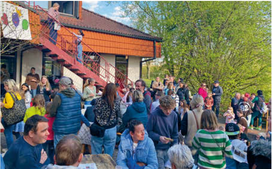
152 Kinder feierten an Gründonnerstag gemeinsam mit ihren Eltern das Dorffest des 25. Kinderclubdorfs.