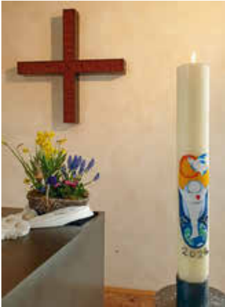
Wunderschön gestaltete Osterkerze in Hainburg